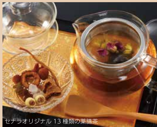
セナラオリジナル 13 種類の薬膳茶